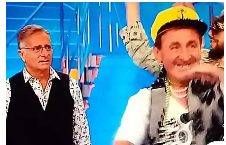
Da Corato a Ciao Darwin