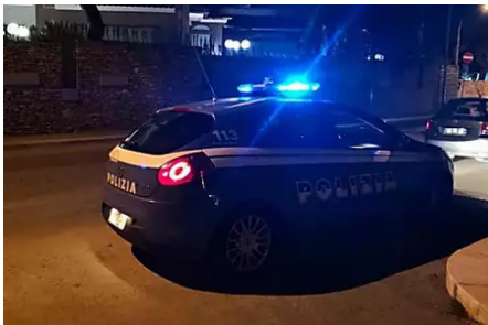
Corato rapina uno zaino

Risparmia tempo, prenota online o blocca il tuo prezzo per 48h. Bambini gratis fino a 6 anni! Club Med